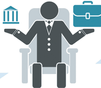
Депутат місцевої ради